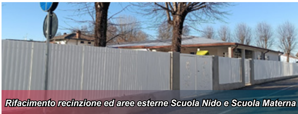
Rifacimento recinzione ed aree esterne Scuola Nido e Scuola Materna

Il Parco delle Pianure d'Europa è una vera e propria opera di rigenerazione degli spazi. Una importante zona residenziale del nostro comune sarà dotata di un moderno parco, area giochi per i più piccoli ed aree fitness per i più grandi. Nel progetto è prevista anche la completa riqualificazione di piazza XI Settembre, con nuove aree parcheggio, ricarica auto elettriche e piantumazioni per fare ombra. Nel progetto, finanziato totalmente dall'Unione Europea, è previsto anche il rifacimento dell'intera recinzione della scuola materna e nido oltre che l'installazione di nuovi giochi ed aree attrezzate in favore dei più piccoli