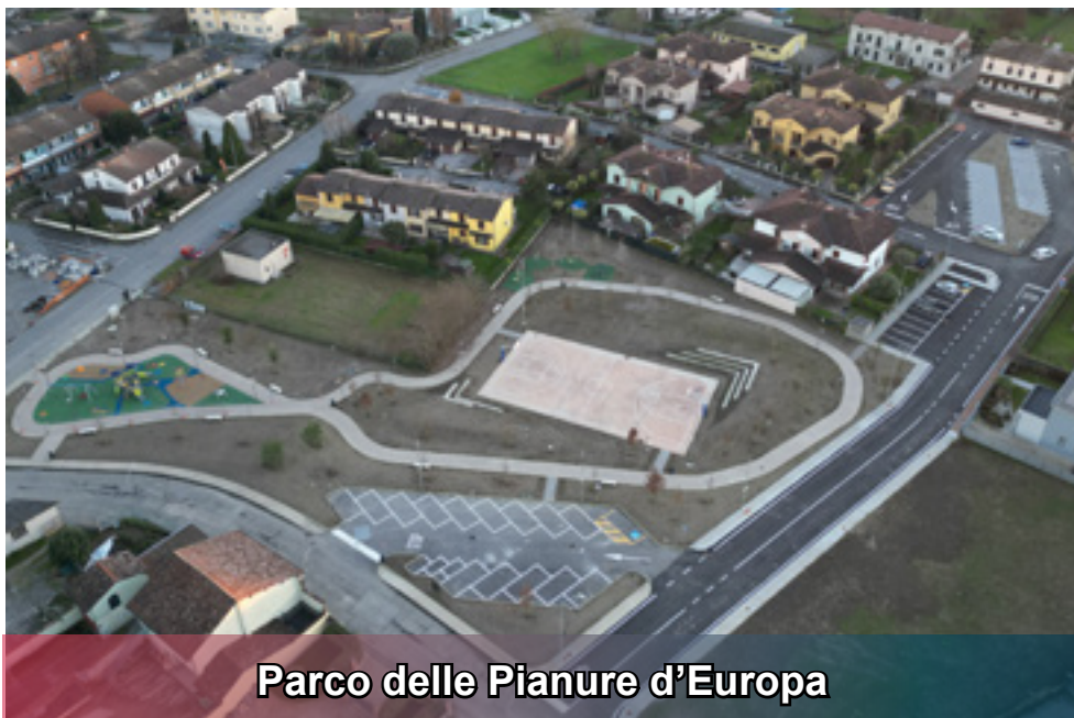
Parco delle Pianure d'Europa

Il Parco delle Pianure d'Europa è una vera e propria opera di rigenerazione degli spazi. Una importante zona residenziale del nostro comune sarà dotata di un moderno parco, area giochi per i più piccoli ed aree fitness per i più grandi. Nel progetto è prevista anche la completa riqualificazione di piazza XI Settembre, con nuove aree parcheggio, ricarica auto elettriche e piantumazioni per fare ombra. Nel progetto, finanziato totalmente dall'Unione Europea, è previsto anche il rifacimento dell'intera recinzione della scuola materna e nido oltre che l'installazione di nuovi giochi ed aree attrezzate in favore dei più piccoli