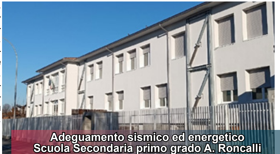
Adeguamento sismico ed energetico Scuola Secondaria primo grado A. Roncalli

La riqualificazione della Scuola A. Roncalli, prevede l'adeguamento sismico di tutta la struttura ed anche il completo efficientamento energetico di tutto l'edificio. Un importante intervento che consentirà di avere un edificio completamente rinnovato e con minor costi di gestione. L'intervento effettuato dall'Unione, ha beneficiato di un contributo a fondo perduto tra PNRR e GSE pari a 2.200.000€ su un importo complessivo di 2.500.000€.