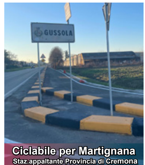
Ciclabile per Martignana Staz.appaltante Provincia di Cremona

L'importante opera della ciclabile di collegamento con Martignana di Po, viene da lontano. Grazie alla progettazione ed alla programmazione il Comune di Gussola, attraverso la Provincia di Cremona, ha ottenuto il totale finanziamento dell'opera con un contributo complessivo di 490.000€. L'intervento, realizzato ed appaltato dalla Provincia, consentirà di mettere in sicurezza un tratto di strada trafficato, collegando i due comuni ed i rispettivi servizi. L'opera realizzata mette in sicurezza il collegamento dei due centri abitati e mette in connessione i servizi presenti sul tracciato, dalle scuole agli impianti sportivi, alla piazza centrale passando per il parco comunale..